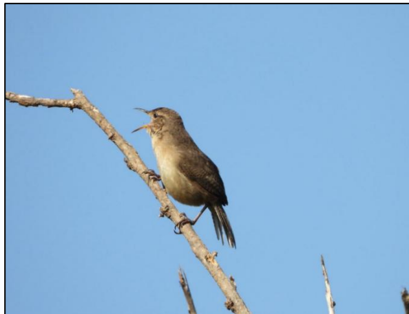
Ilustración 5. Cucarachero común