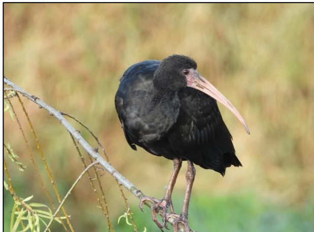
Ilustración 4. Ibis