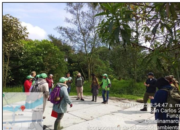
Ilustración 7. Espacio de reflexión