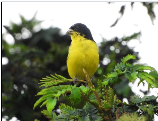
Ilustración 3. Chisga capinegra