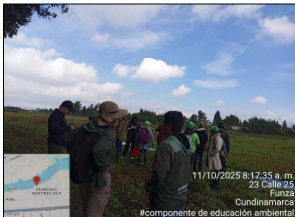
Ilustración 6. Registro plataforma eBird

Al finalizar el recorrido, se realizó una sesión de retroalimentación en la que los participantes compartieron sus experiencias, reflexionaron sobre la importancia de la conservación de las aves y registraron sus observaciones en la plataforma eBird, contribuyendo al fortalecimiento de la ciencia ciudadana.