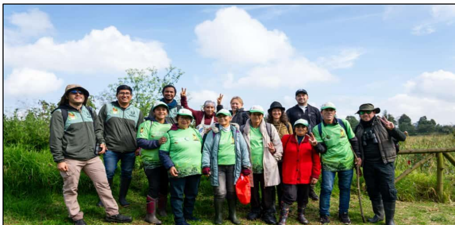
Ilustración 1. Participantes October Big Day

El October Big Day reunió a integrantes del Club de la Biodiversidad y a algunos miembros del programa Guardianes por el Ambiente, en una jornada de observación de aves orientada a fortalecer el conocimiento, la participación y la conciencia ambiental en el municipio de Funza. Esta fecha reviste un significado especial para Colombia, al coincidir con la llegada de las aves migratorias boreales que visitan el país entre los meses de septiembre y mayo, ofreciendo una oportunidad única para apreciar la riqueza de especies que habitan y transitan por nuestros ecosistemas.